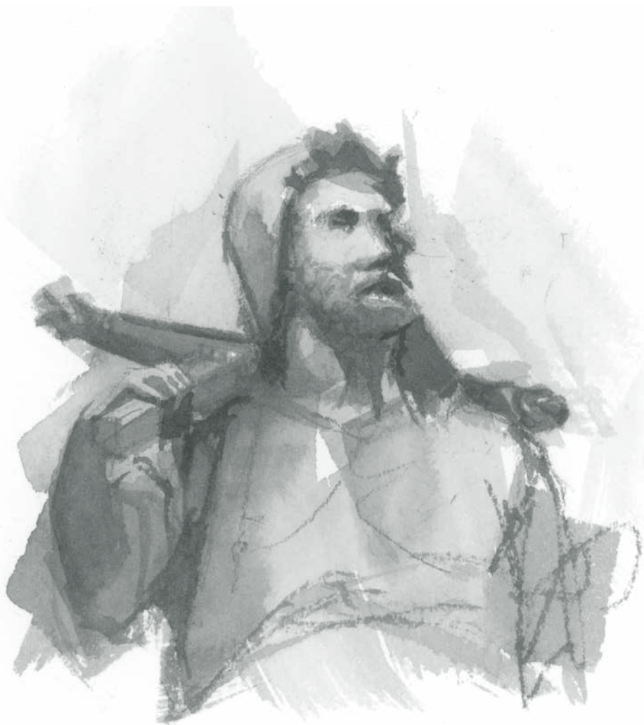
Guillermo Tell. Acuarela sobre papel. Lola Montero.